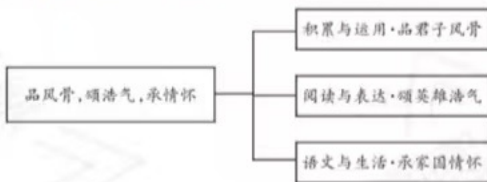
图2 “品风骨,颂浩气,承情怀”作业任务群

语文作业是学生学习的第二课堂,教师应该将每项作业练习相互联系、相互贯通。教师要把握语文新课标中“学习任务群”的特点,通过“学习任务群”的形式,设计知识难度层层递进的作业,让学生进行深层次学习。例如,统编语文教材六年级下册第四单元以“理想和信念”为主题,编排了四篇课文和综合性学习,单元语文要素有“关注外貌、神态、言行的描写,体会人物品质”“查阅相关资料,加深对课文的理解”。在进行单元作业设计时,笔者将这两个要素进行综合运用,设置“品风骨,颂浩气,承情怀”的作业任务群(见图2),同时设置“积累与运用·品君子风骨”“阅读与表达·颂英雄浩气”“语文与生活·承家国情怀”三个任务,深层次挖掘语文要素的内涵,推动语文古诗教学的发展。